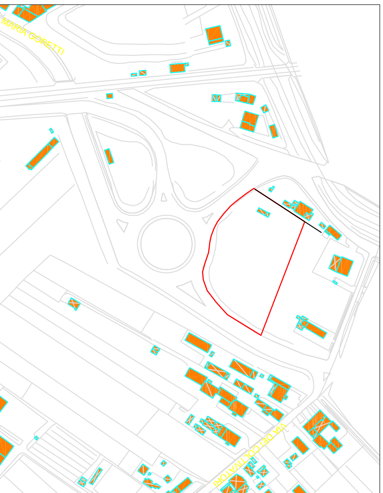
Estratto cartografico - Inquadramento da C.T.R. Regione Toscana