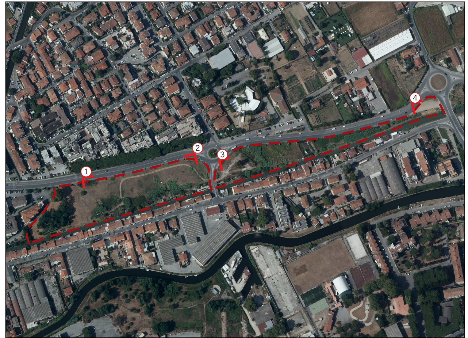
Estratto Ortofotocarta Regione Toscana volo del 2021