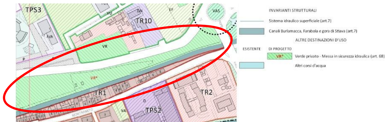
Figura 6 – Estratto Tav.c.1.10 – Disciplina dei Suoli e degli Insediamenti area interessata (fonte Regolamento Urbanistico)

Per queste specifiche porzioni di territorio comunale, collocate in aree destinate a “Verde privato”, in particolare si ha la Destinazione d’uso “Verde privato - VR*”, che nelle NTA del R.U. è inserita nell’art.68 comma 6 - “Aree private di tutela”.