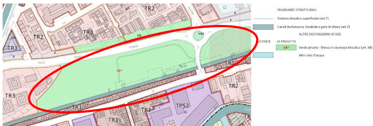
Figura 5 – Estratto Tav.c.1.9 – Disciplina dei Suoli e degli Insediamenti area interessata (fonte Regolamento Urbanistico)