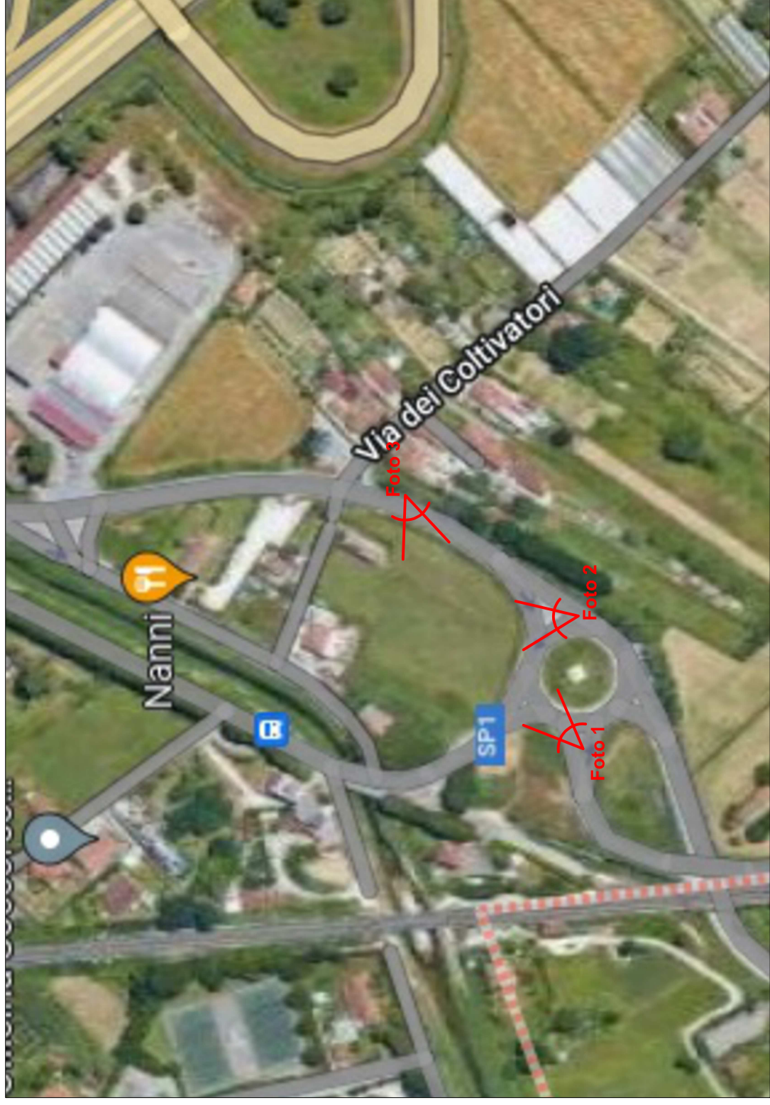
Estratto cartografico da immagine satellitare google maps