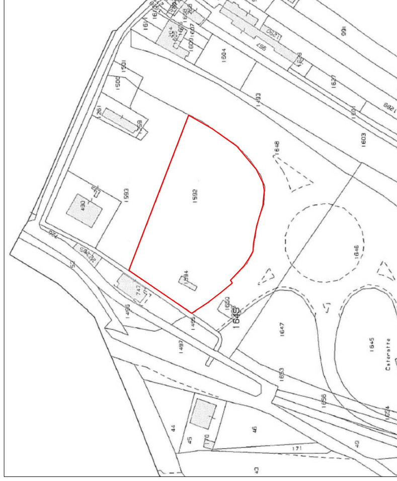
Estratto cartografico - mappale catasto Foglio 6 part. 1592