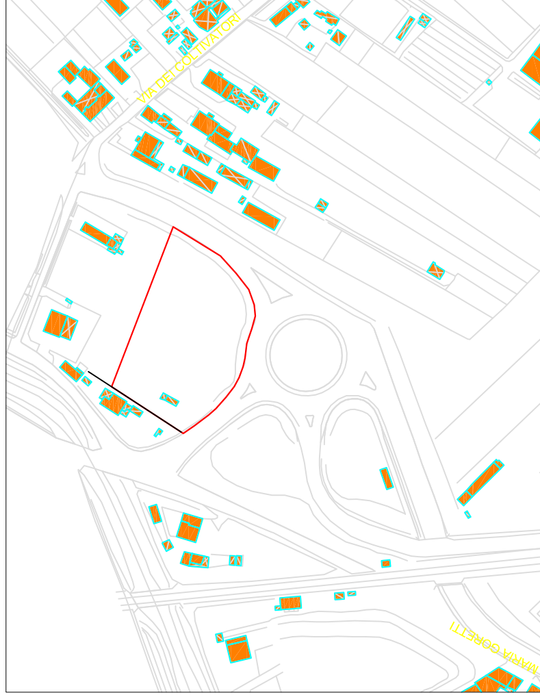
Estratto cartografico - Inquadramento da C.T.R. Regione Toscana